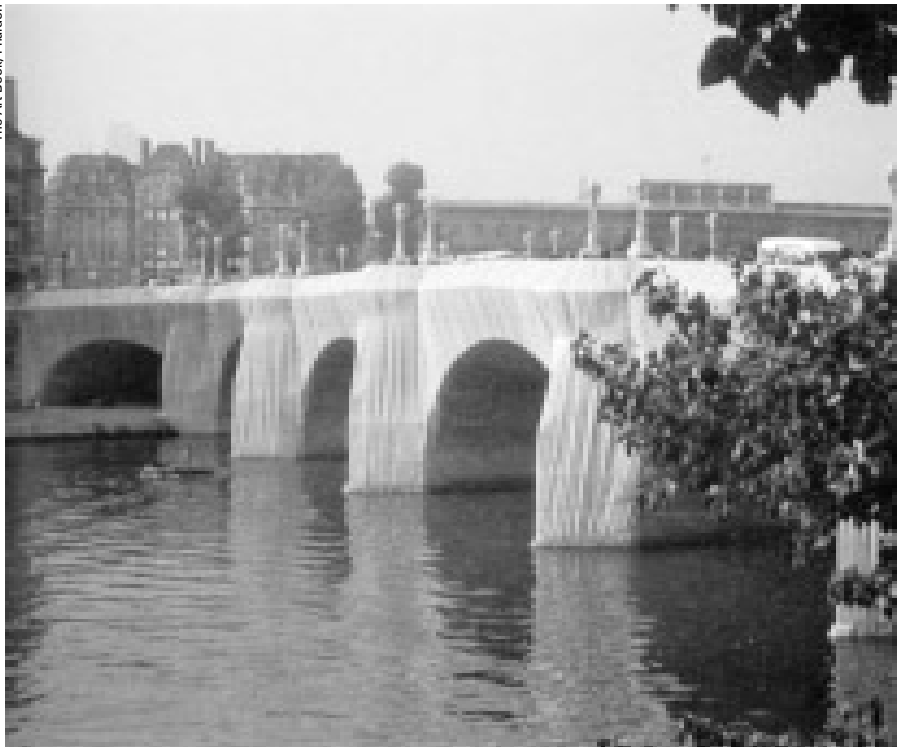
O escultor Javacheff Christo "embrulha" monumentos e obras de engenharia, criando uma nova forma de olhar

Publicado na Folha de S.Paulo, em 23/02/92.